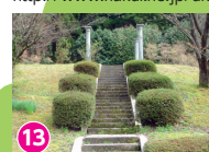
13 モーゼパーク 能登のミステリアススポット 「ほっと石川旅ねっと」サイト内参照