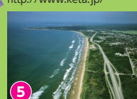
5 なぎさドライブウェイ 波打ち際を自動車で行く可能 「ほっと石川旅ねっと」サイト内参照