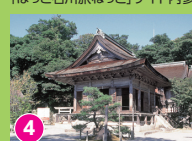
4 気多大社 緑結びの神様で有名 http://www.keta.jp/