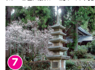
7 明泉寺 国の重文、石造りの五重塔がある 「ほっと石川旅ねっと」サイト内参照