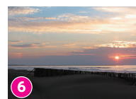
6 内灘海岸 GWに「世界の風の祭典」開催 「ほっと石川旅ねっと」サイト内参照