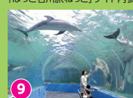
9 のとじま水族館 トンネル状の大水槽は圧巻 http://www.notoaqua.jp/