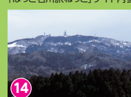
14 宝達山 某タワーとほぼ同じ高さの山 「ほっと石川旅ねっと」サイト内参照