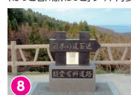
8 別所岳 SA 天気が良ければ立山連峰も見える 「ほっと石川旅ねっと」サイト内参照