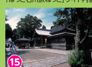
15 俱利伽羅不動寺 周辺には源平古戦場がある http://www.kurikara.jp/