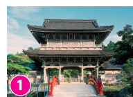
1 総持寺祖院 座禅体験や精進料理が食べられる http://www.wannet.jp/noto-soin/