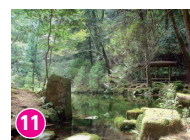
11 御手洗池 名水百選 「ほっと石川旅ねっと」サイト内参照