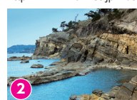
2 ヤセの断崖 松本清張「ゼロの焦点」の舞台 「ほっと石川旅ねっと」サイト内参照