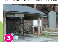
3 藤瀬の水 平成名水百選 「ほっと石川旅ねっと」サイト内参照