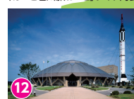
12 コスモアイル UFO型巨大ドーム博物館 http://www.hakui.ne.jp/ufo/